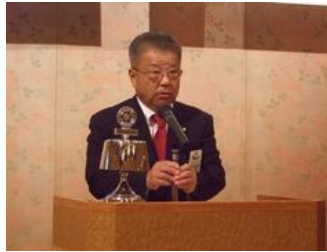
初めての会長挨拶