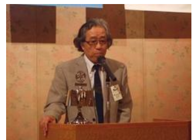
金山土洲パスト会長