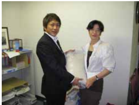
在浜松ブラジル人支援物資を 浜松中RCへ

会報デジタル部会・横田誠司;7/29にメール配信させて頂きました週報作成のご協力依頼です。委員会&同好会報告は書面にて例会当日の終了時までに会報デジタル部会へご提出下さい。(用紙は受付に置いてあります)卓話録は例会担当部会・PJが責任を持って作成し例会開催の翌日までに電子データで部長および事務局へご提出下さい。