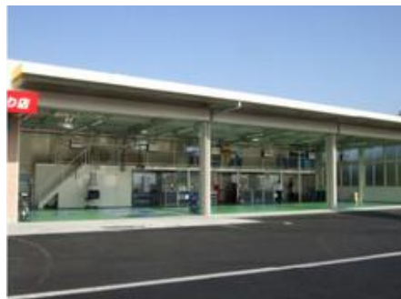
コバック浜北アピタ通り店工場