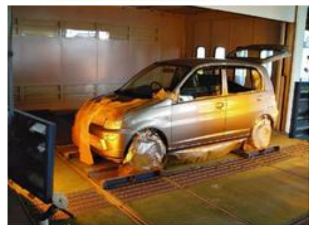
豊岡テクノセンター