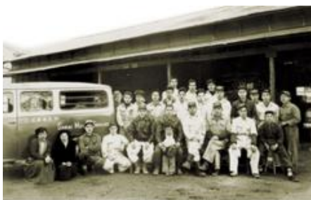
昭和30年頃の坂井鉄工所