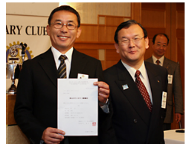
米山奨学生カウンセラー委嘱状を手にする高木委員長