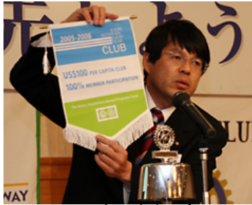
ロータリー財団表彰パナー